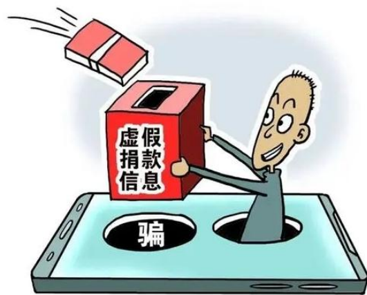
以慈善之名，行诈骗之实

不法分子通过虚假网站和微信等社交软件，冒充慈善机构、民政部门、医院、爱心人士等向消费者发送“献爱心”的虚假募捐信息。