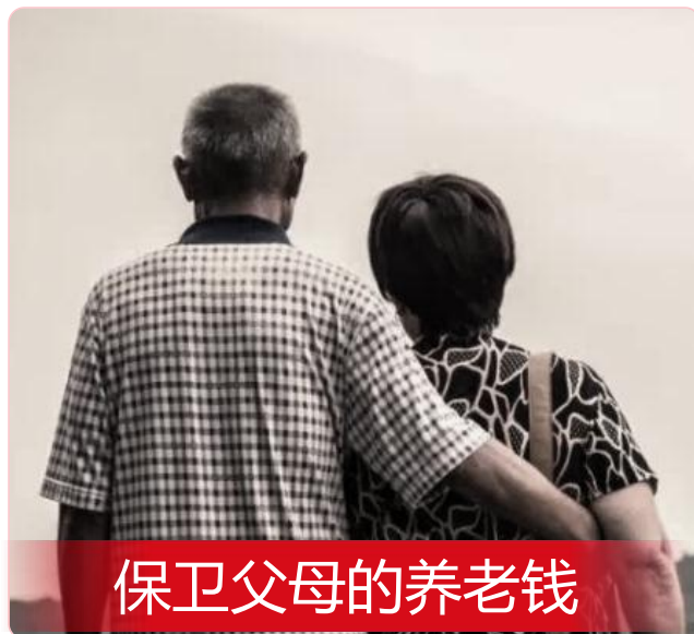
保卫父母的养老钱