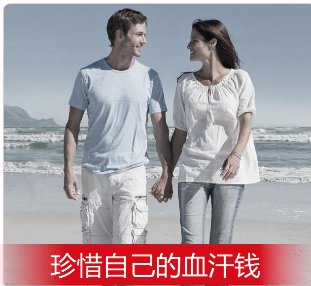
珍惜自己的血汗钱