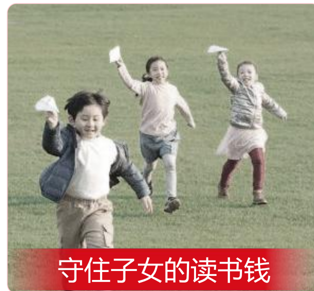
守住子女的读书钱